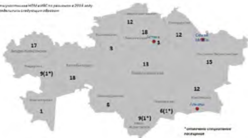
Визиты участковые НПМ в ИВС по регионам в 2016 году распределены следующим образом

лые помещения, увеличивающиеся случаи небезопасности медицинского обслуживания, отсутствие действенного механизма подачи жалоб, а также недостатки, связанные с обустройством прогулочных дворов. В отдельных учреждениях отмечены сырость, недостатки в изоляции санузлов, несоблюдение санитарно-гигиенических норм по освещению,