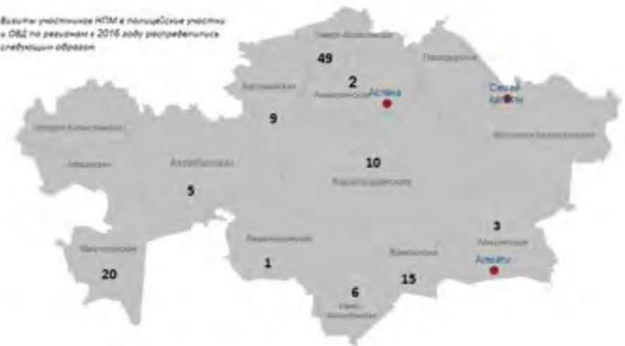
Визиты участников НПМ в полицейские участки в ОВД по регионам в 2016 году распределялись следующим образом:

ния сотрудников полиции. Например, не в полной мере решены вопросы по обеспечению УИП техническими средствами для фиксации фактов совершения уголовных или административных правонарушений и действий сотрудников ОВД. Участковые пункты полиции не оборудованы средствами видеонаблюдения. Не обеспечено поэтапное снабжение участковых инспекторов полиции портативными переносными видеорегистраторами (видеожетонами). Не установлены технические средства наблюдения в помещениях, где проводится допрос. Участковые