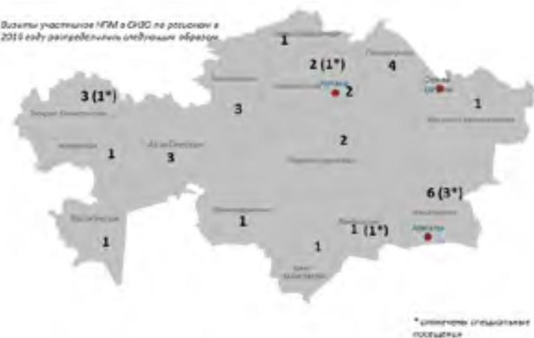
Визиты участников НПМ в СИЗО по регионам в 2016 году распределены следующим образом

на шансах на справедливое судебное разбирательство и презумпцию невиновности. Это повышает риск получения признания или заявления путем применения пыток или жестокого обращения, а также «снижает возможности защиты лица, подозреваемого в совершении преступления, особенно в тех случаях, когда