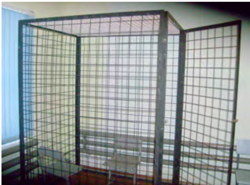
Клетка для беседы участников НПМ Костанайской области в УК 161/2 с заключенными. Это единственно место, где участники НПМ могут говорить с заключенными конфиденциально.

администрации учреждений искусственно создается физический и психологический барьер между представителями независимой инспекции и осужденными. Несмотря на критическую оценку «клеток безопасности» национальными и международными экспертами, в исправительных учреждениях Казахстана остается практика их применения. Так, например,