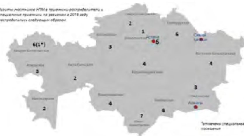
Визиты участковые НПМ в приемники-распределители и специальные приемники по регионам в 2016 году распределены следующим образом

Во многих регионах остаются нерешенными вопросы медицинского обслуживания, особенно в ночное время, недостаточное оснащение медицинских кабинетов лекарственными препаратами и оборудованием. Кроме этого, практически все группы