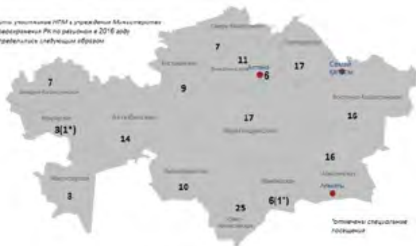
Визиты специалистов НПМ в учреждения Министерства здравоохранения РБ по результатам в 2016 году распределялись следующим образом:

билитационного направления в терапии пациентов, в особенности в отношении пациентов с ментальными нарушениями здоровья. В психиатрических больницах по-прежнему существуют исторически сложившиеся подходы сдерживания, ограничения и изоляции пациентов. Отсутствие занятий по интересам, пассивное времяпровождение ведут к дальнейшей деградации личности, утере социальных, бытовых и жизненных навыков. В консолидированных докладах о деятельности НПМ в 2014 и 2015 годах отдельную обеспокоенность вызывали факты воспрепятствования визитов НПМ в организации здравоохранения. В 2016 году отказов в проведении превентивных визитов стало меньше. Но, тем не менее, группы НПМ все еще сталкиваются с такими проблемами в регионах. По результатам визитов НПМ в 2016 году в учреждениях здравоохранения